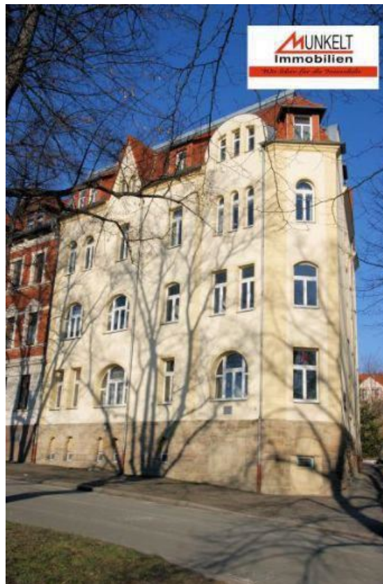
Röntgenstraße NR 09, 06712 Zeitz